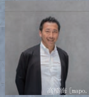
建築家 / 京都芸術大学特任教授