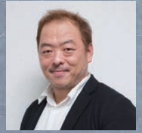
神戸大学大学院 教授