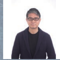
ランドスケープアーキテクト 大阪芸術大学 教授