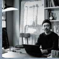
建築家 / コルアーキテクト