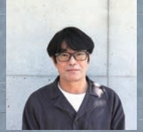
神戸大学大学院 教授