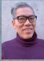
建築家 / 芝浦工業大学教授 法政大学客員教授